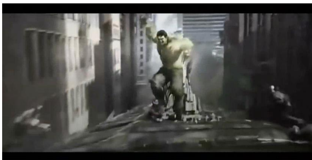
「復仇者聯盟」觀摩影片