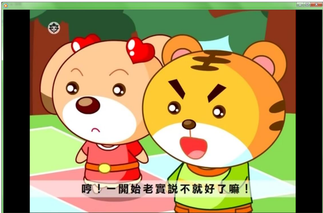
【說謊的代價】動畫短片