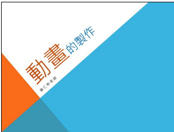
【動畫的製作】投影片