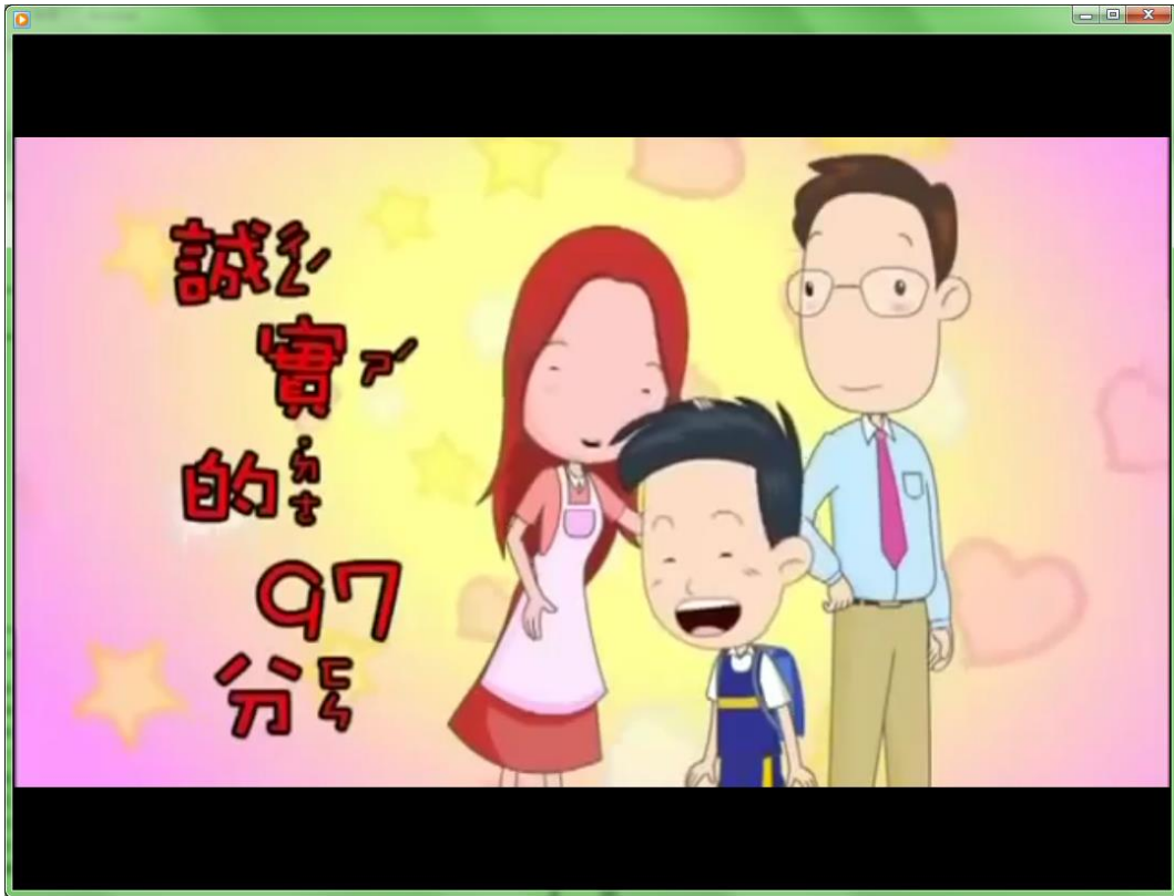
【誠實的97分】動畫短片